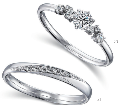
20. チュチュラスター 21. クロト