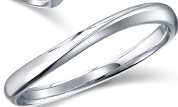
16. フルーラ 17. フルーラ 18. プルジョン 19. プルジョン